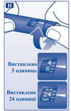
Рис. Н. Повернути селектор дози, щоб обрати необхідну кількість одиниць для ін'єкції.

Доза може бути відкоригована як у бік збільшення, так і зменшення обертанням селектора дози у відповідному напрямку, поки необхідна доза не буде збігатися з показчиком дози. При обертанні селектора стежити за тим, щоб випадково не надавити пускову кнопку, оскільки це призведе до витікання інсуліну.