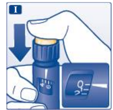
Рис. І. Ввести дозу, натискаючи до кінця пускову кнопку, поки «0» не зрівняється з показчиком дози. Будьте уважні, щоб під час виконання ін'єкції натискати лише пускову кнопку.

Обертання селектора дози не призведе до введення інсуліну.